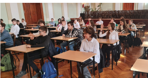
Bystrzak Językowy (marzec 2024)