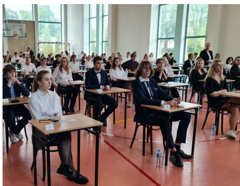
matura z języka polskiego (maj 2024)

Nasi absolwenci osiągają wysokie wyniki na egzaminie maturalnym. W naszej szkole dobrze przygotujesz się do matury na poziomie rozszerzonym, bo czeka na ciebie nie tylko wykwalifikowana kadra, ale także bogata oferta edukacyjna,