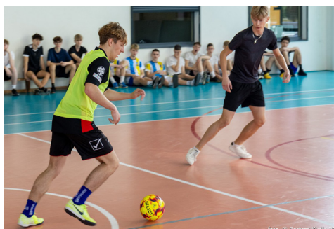
Zawody w piłkę nożną (luty 2025)