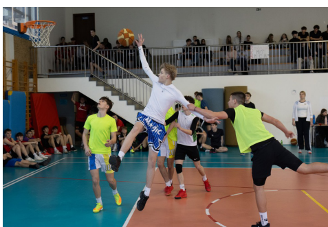
Zawody w koszykówkę 3x3 (styczeń 2025)

O sportowych sukcesach licealistów oraz o zawodach sportowych znajdziesz wiele informacji na stronie internetowej szkoły www.lostrzelin.pl