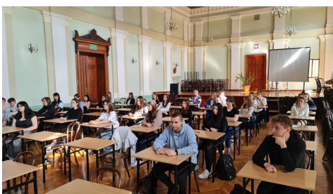
Strzeliński Poliglota (kwiecień 2024)

Młodzi ludzie są najważniejsi! Wiedzą o tym nasi nauczyciele, dlatego organizują powiatowe konkursy przedmiotowe, które uzyskały wpis na listę konkursów organizowanych przez Dolnośląskiego Kuratora Oświaty. Laureaci i finaliści tych konkursów mogą otrzymać za swoje osiągnięcia dodatkowe punkty rekrutacyjne. Z pewnością słyszałeś o konkursie „Bystrzak Językowy” lub „Strzeliński Geniusz Matematyczny”, o innych, których autorami są nasi nauczyciele. Sprawdź swoją wiedzę i weź udział w jednym z nich!